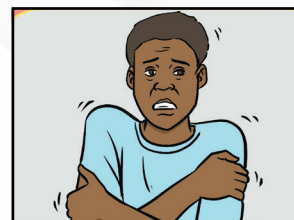
Gbo na mugu pomoni