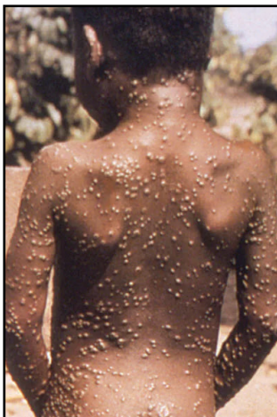
no na lupundo adi swar i 'boriko na mugu