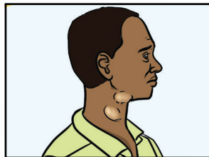
Abuonoror a ngangarwei