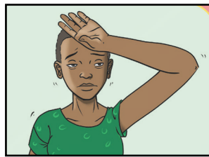
Amwanis ka akuwan