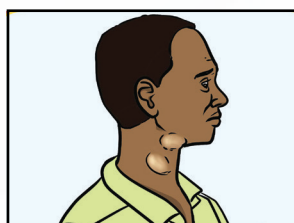
Limp nōdn̄i tin ci puɔt