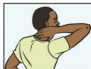
Puɔɔny / Riŋ