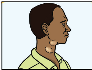
ሕበጥ ጽክታት ሊምፍ